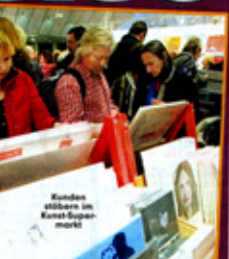
Kunden stöbern im Kunst-Super- markt

ro. Der Laden ist noch bis 31. Januar geöffnet. Über 5000 Werke von über 70 Künstlern warten auf Kundschaft. Und die ist von der Idee begeistert.